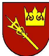
Starostwo Powiatowe w Nowym Targu