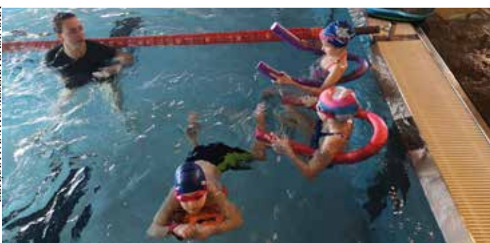
Podczas zajęć radzimy sobie bardzo dobrze.