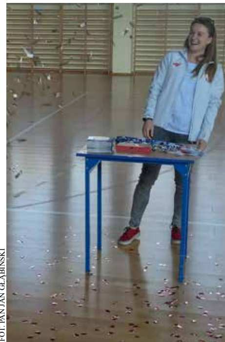
📍 Kingę przywitaliśmy w naszej szkole z największymi honorami! W końcu jesteście z Niej bardzo dumni!

- Zachęcam was, by angażować się w życie szkoły, mnie wszędzie było pełno - przyznawała nasza absolwentka.