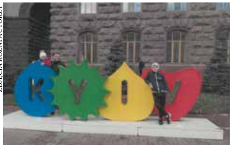
📍 W Kijowie - stolicy Ukrainy. 📍 Wielka ta piłka!

mieszkałam jak wszystkie dzieci, studiowałam, chodziłam do klubu tanecznego, bawiłam się z przyjaciółmi. Kiedy Rosjanie nas zaatakowali, rodzice postanowili zabrać nas do bezpiecznego kraju, więc zdecydowaliśmy się przyjechać do Polski. Jesteśmy bardzo wdzięczni Polsce i Polakom za ich wsparcie i gościnność. Żyją tu niesamowici ludzie i piękno Polski robi wrażenie.