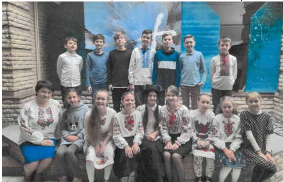
📍 Klasa Kateryny. Oby jak najszybciej mogli się znowu razem uczyć.