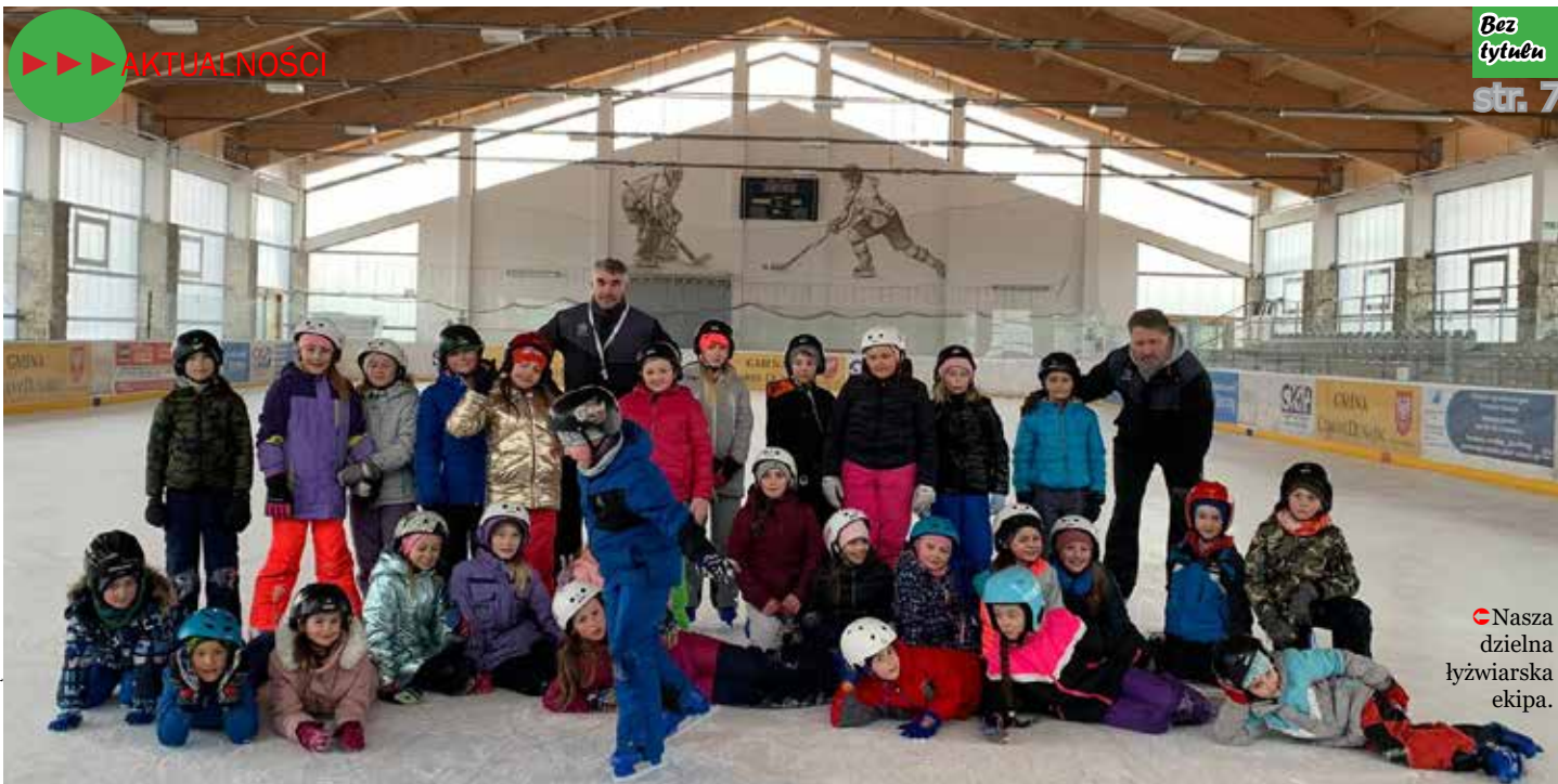
Nasza dzielna łyżwiarska ekipa.

Tylko 13 samorządów w całej Polsce otrzymało w roku 2022 dofinansowanie na zajęcia sportowe dla uczniów, na upowszechnienie sportów zimowych. Wśród tych samorządów znalazła się Gmina Czarny Dunajec, która pozyskała po raz kolejny dofinansowanie na realizację projektu „Moje łyżwy” dla 240 dzieci z terenu Gminy Czarny Dunajec, w tym naszych uczniów! W ramach projektu dzieci całkowicie za darmo pojechały na lodowisko w Czarnym Dunajcu,