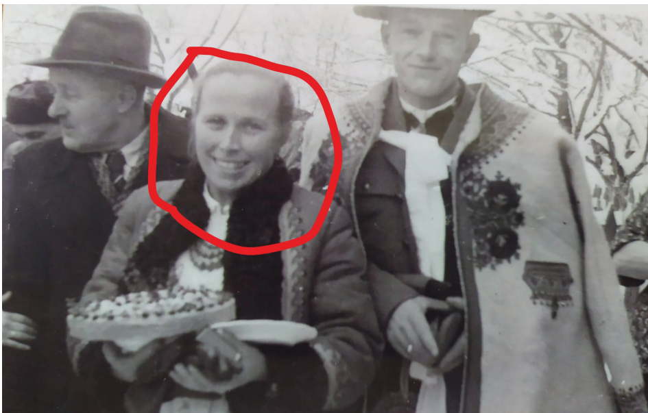
📍Babcia Pawła w dniu własnego ślubu.

Mieszkałam w Takuśkach i chodziłam do szkoły do Czerwienego Dolnego. Musiałam iść ponad pół godziny pod górę i nie zawsze ta podróż była