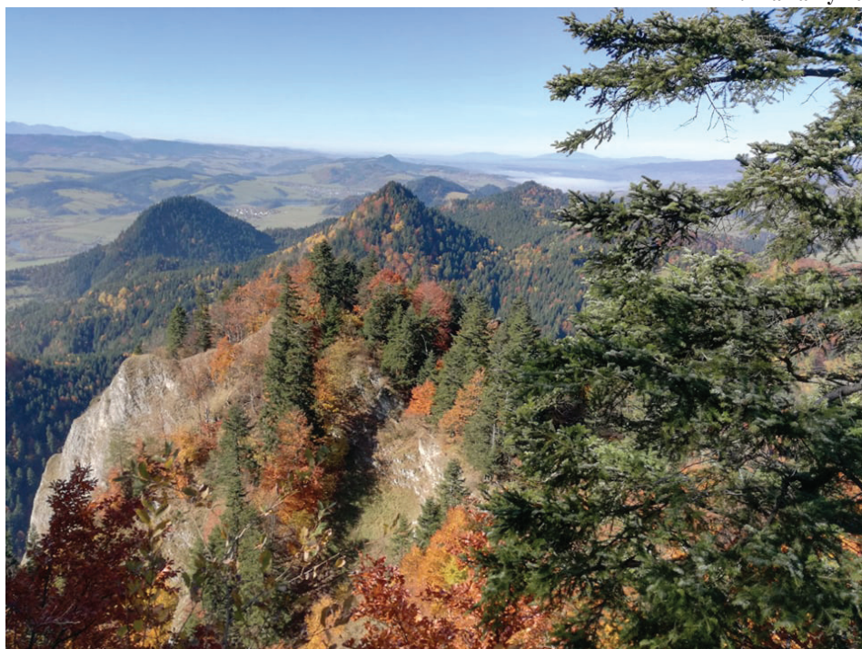
Widoki zapierające dech w piersiach, taka jest nasza Narnia...